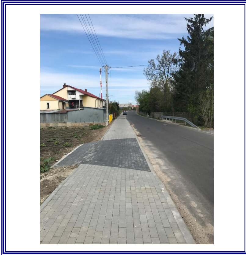
Przebudowa drogi powiatowej Nr 2617 C Straszewo-Koneck