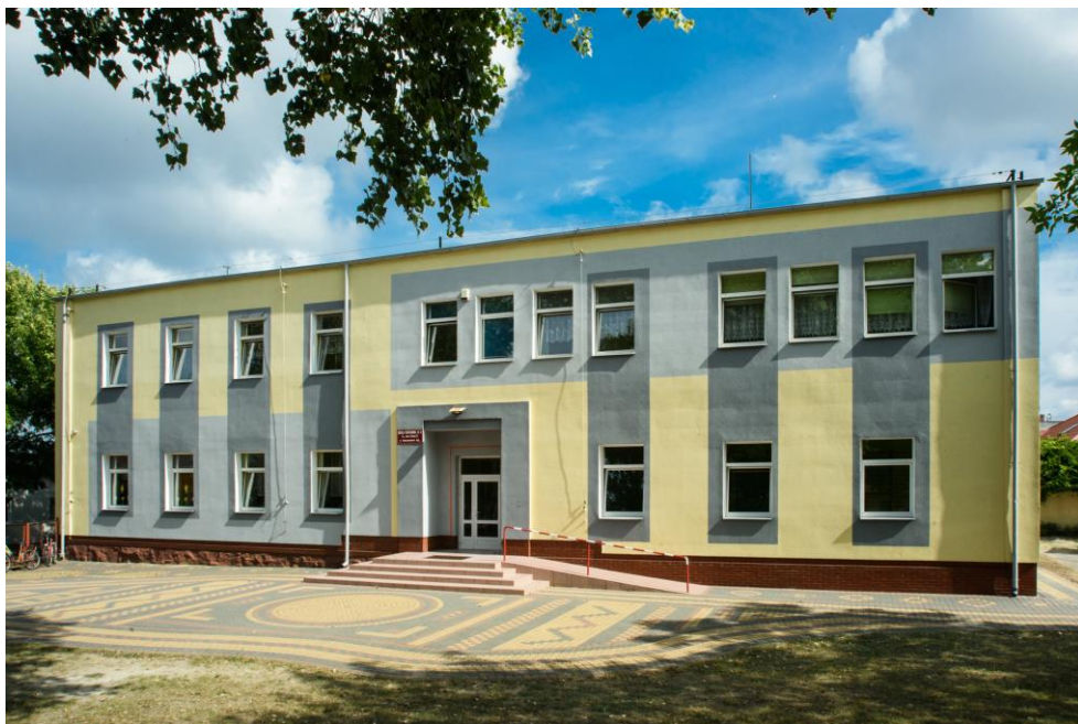
Rozbudowa SPS Nr 4 w Aleksandrowie Kujawskim