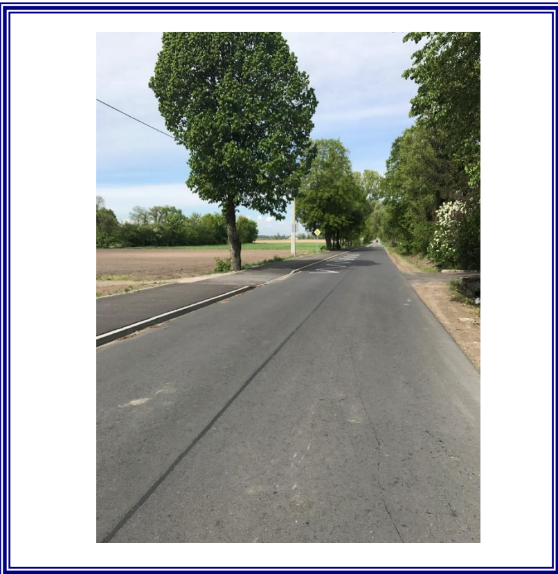
Przebudowa drogi powiatowej Nr 2618C Spoczynek-Zbrachlin