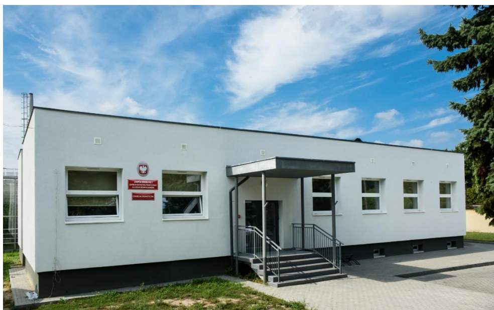
Przebudowa budynku na centrum dydaktyczne przy Zespole Szkół Nr1 CKP w Aleksandrowie Kujawskim