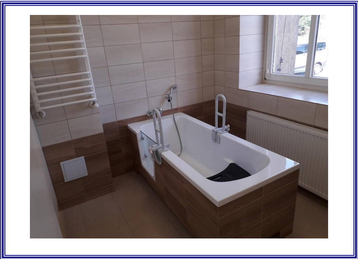
Remont łazienek z przystosowaniem dla osób niepełnosprawnych w Domu Pomocy Społecznej w Zakrzewie