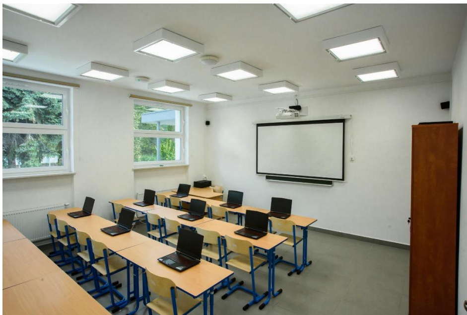
Przebudowa budynku na centrum dydaktyczne przy Zespole Szkół Nr1 CKP w Aleksandrowie Kujawskim