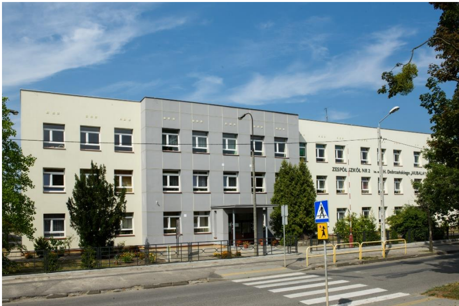
Termomodernizacja budynków Zespołu Szkół Nr 2 w Aleksandrowie Kujawskim