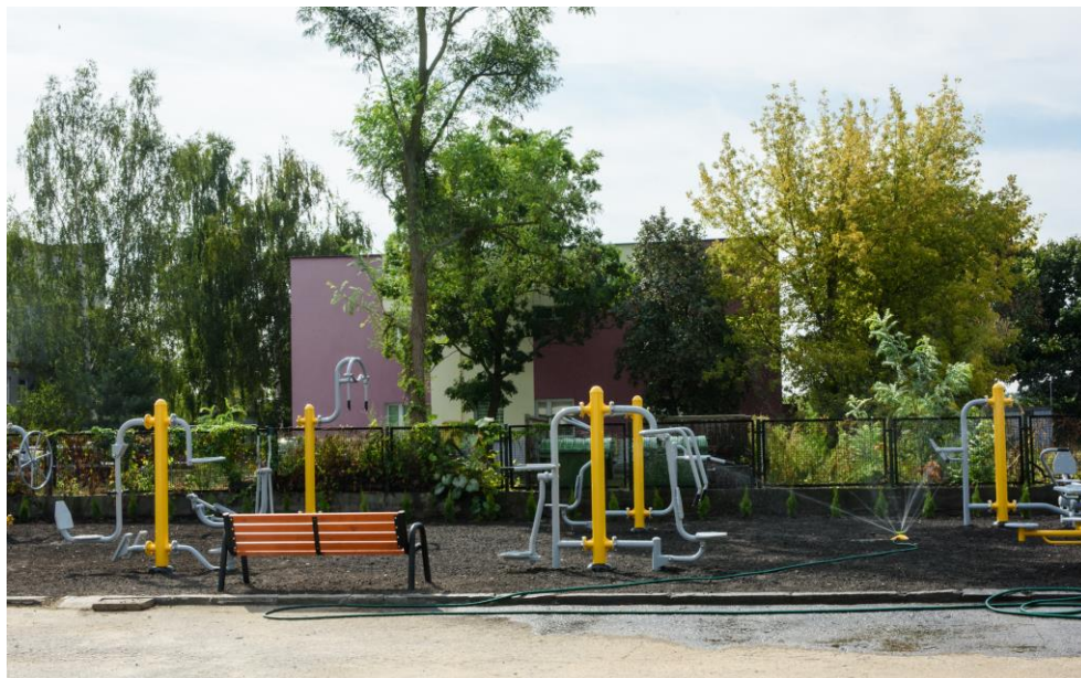
Otwarta Strefa Aktywności przy Zespole Szkół Nr 2 w Aleksandrowie Kujawskim