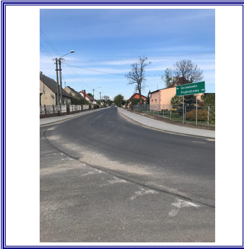
Przebudowa drogi powiatowej Nr 2528C Żyrosławice-Przybranowo