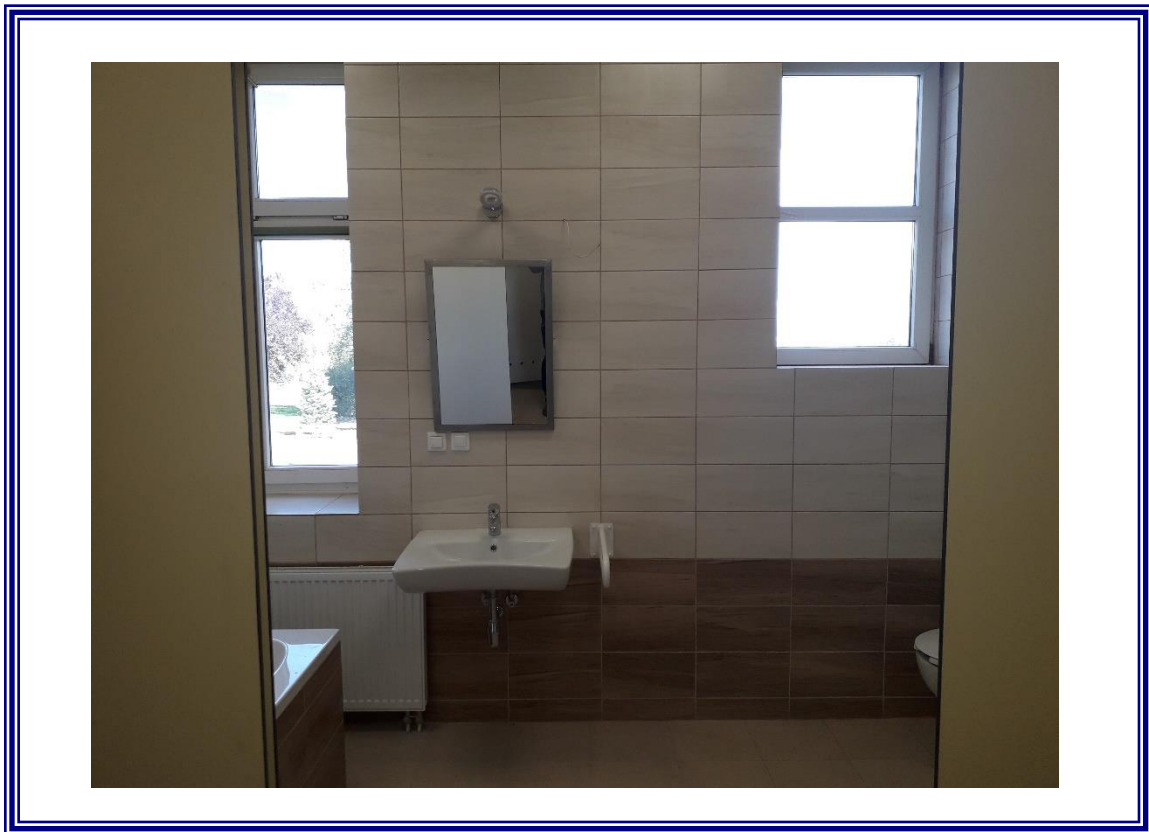
Remont łazienek z przystosowaniem dla osób niepełnosprawnych w Domu Pomocy Społecznej w Zakrzewie