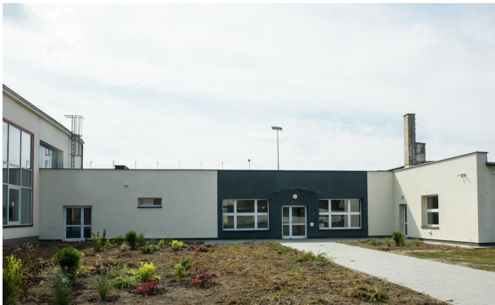
Adaptacja budynków Zespołu Szkół Nr2 w Aleksandrowie Kujawskim na warsztaty szkolne