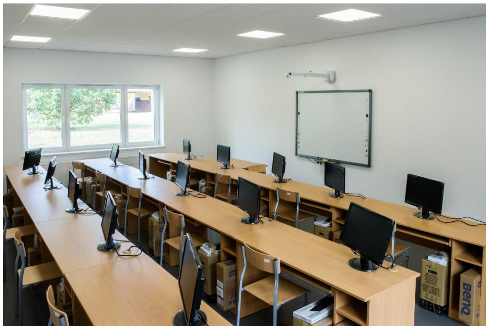
Adaptacja budynków Zespołu Szkół Nr2 w Aleksandrowie Kujawskim na warsztaty szkolne