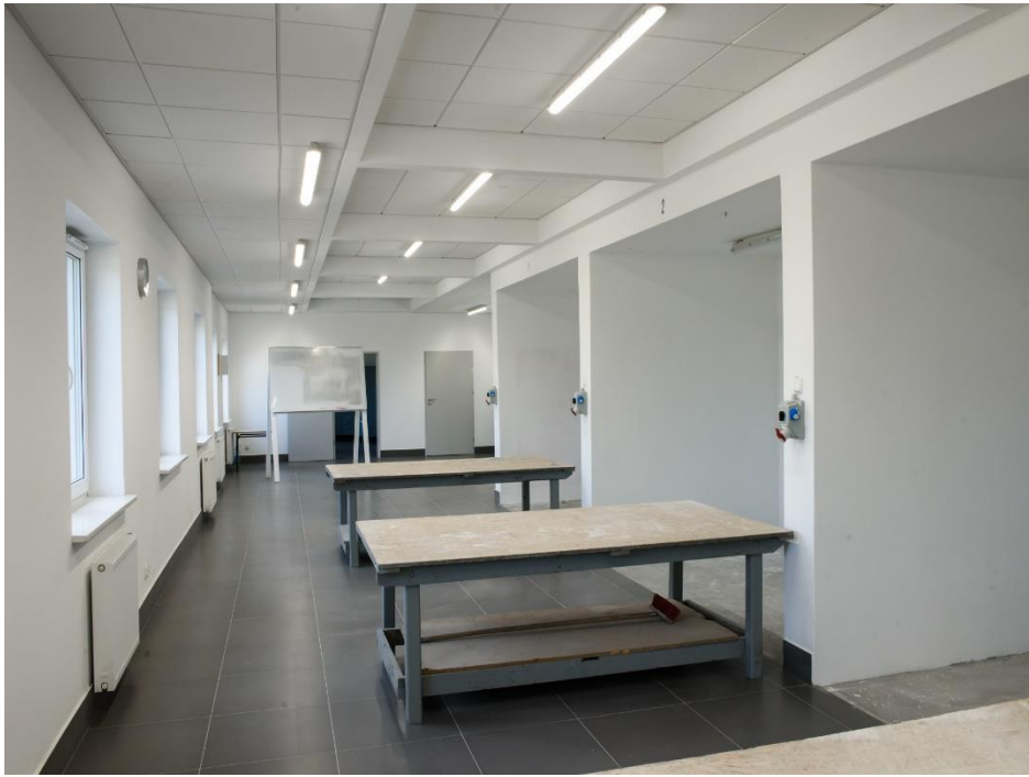
Adaptacja budynków Zespołu Szkół Nr2 w Aleksandrowie Kujawskim na warsztaty szkolne