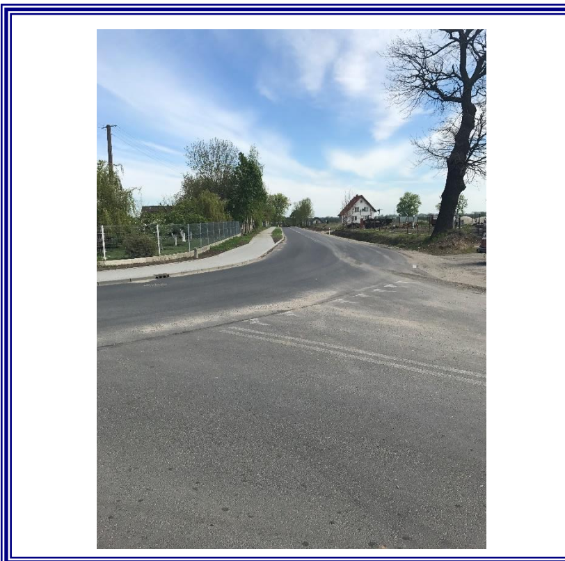
Przebudowa drogi powiatowej Nr 2528C Żyrosławice-Przybranowo