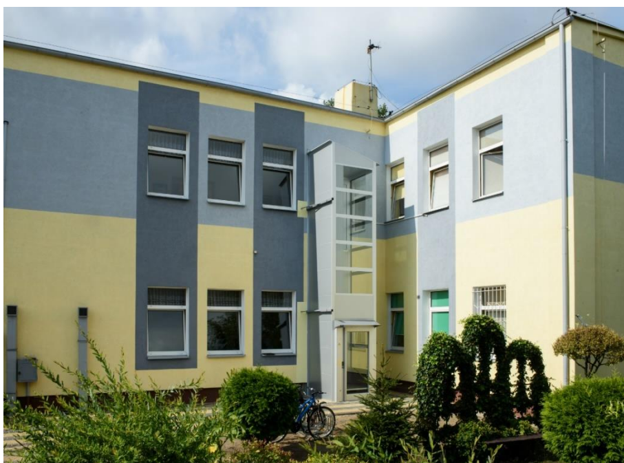
Rozbudowa SPS Nr 4 w Aleksandrowie Kujawskim