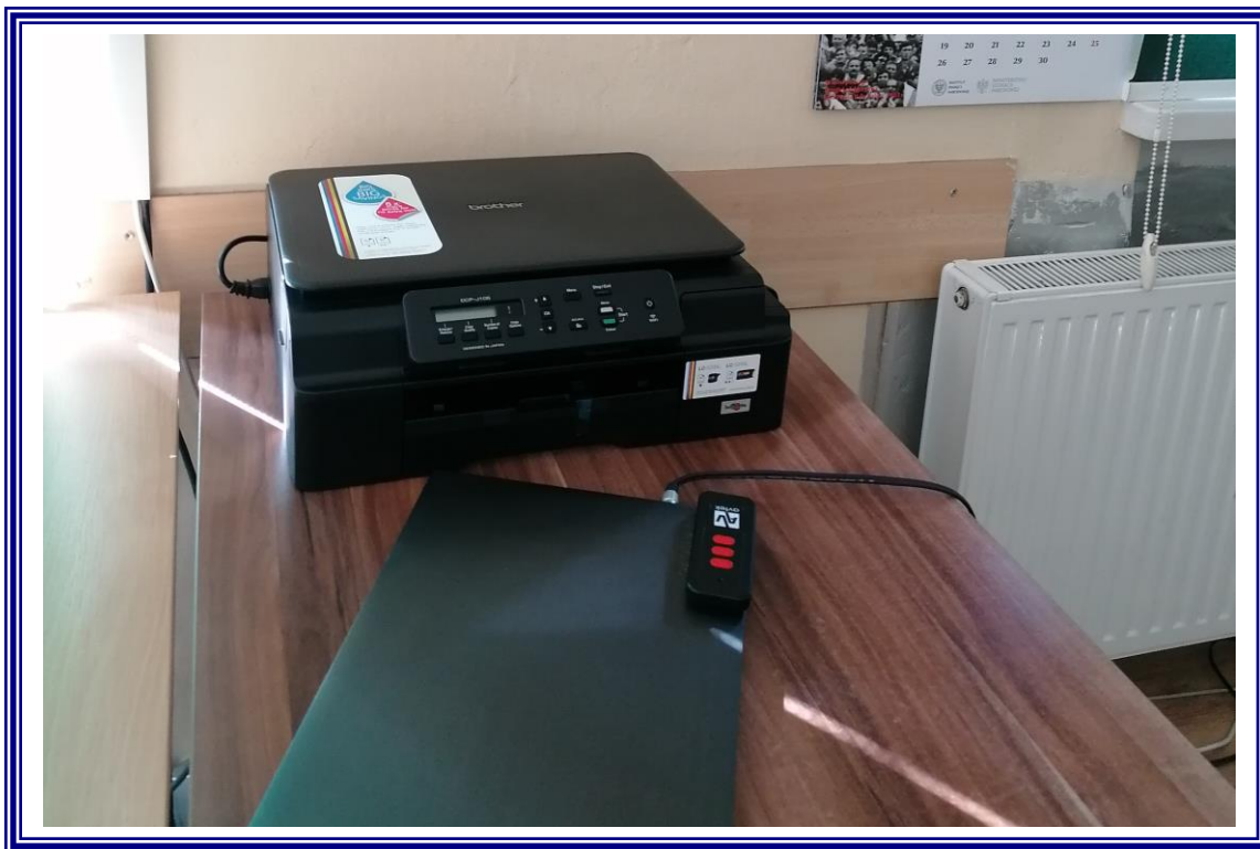
Zakup wyposażenia do pracowni szkolnych w ramach realizacji projektu „Dobry zawód to przyszłość – II edycja” dla uczniów Liceum Ogólnokształcące w Ciechocinku.