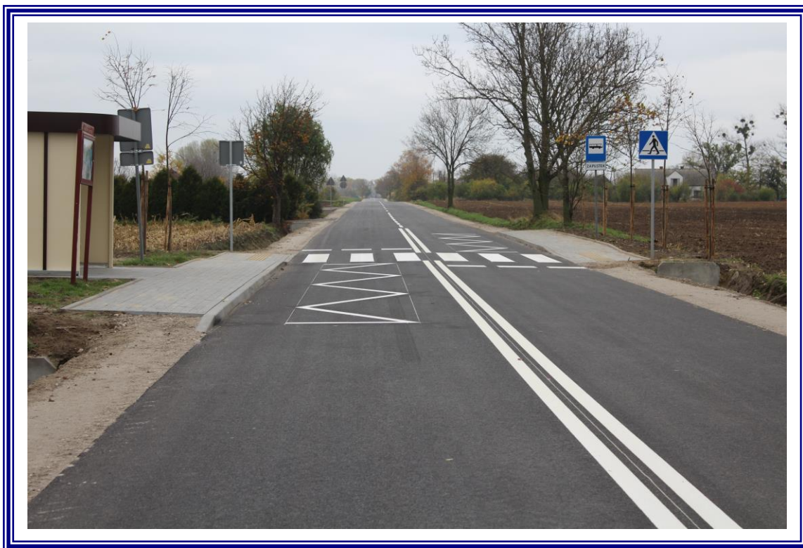
„Przebudowa drogi powiatowej Nr 2610C Turzno – Seroczki na odcinku od km 13+518 – odcinek o długości 4,412 km”.