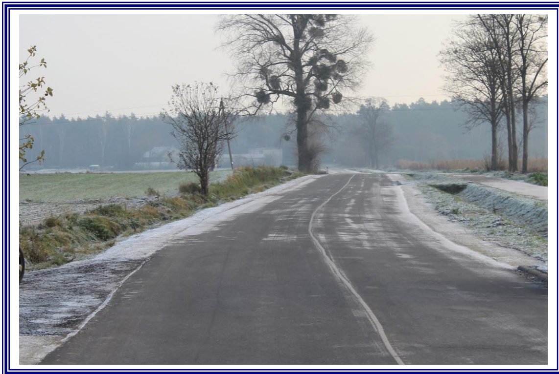
„Przebudowa drogi powiatowej Nr 2617C Straszewo – Koneck wraz z przebudową przepustu drogowego na rzece Tążyna o numerze JNI 01020809 w km 0+107 – etap II – odcinek o długości 0,585 km”.