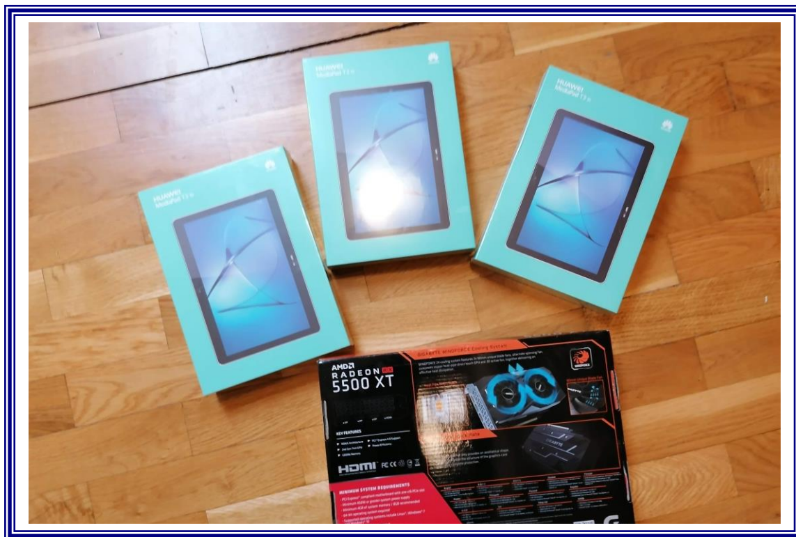
Zakup wyposażenia w ramach realizacji projektu „Dobry zawód to przyszłość – II edycja” dla uczniów Szkoły Podstawowej Specjalnej Nr 4 w Aleksandrowie Kujawskim.