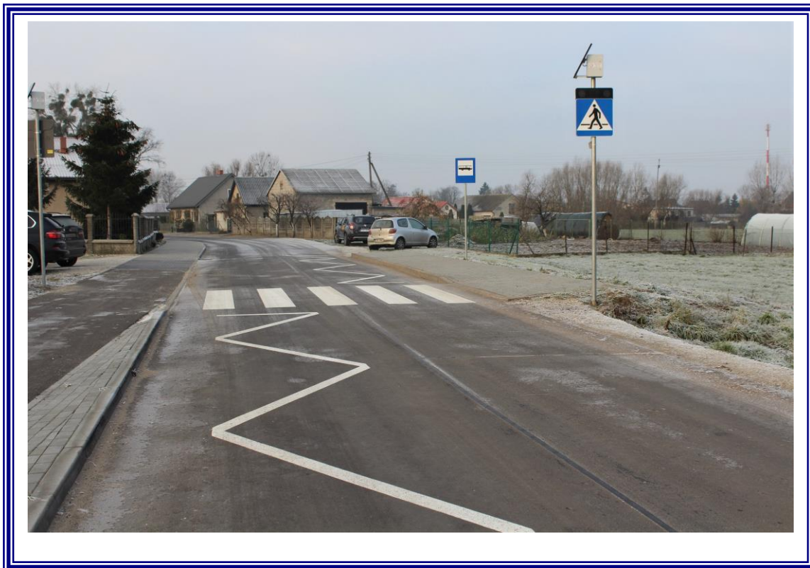
„Przebudowa drogi powiatowej Nr 2617C Straszewo – Koneck wraz z przebudową przepustu drogowego na rzece Tążyna o numerze JNI 01020809 w km 0+107 – etap II – odcinek o długości 0,585 km”.