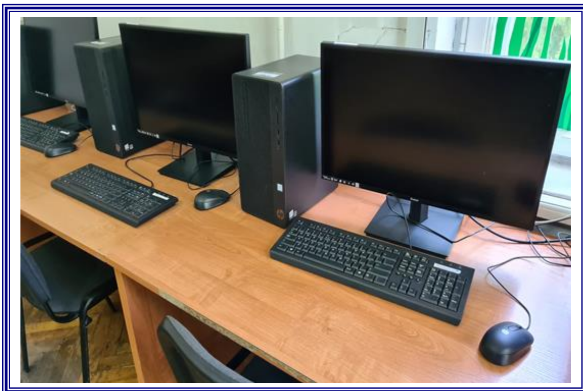
Wyposażenia Sali informatycznej w ramach realizacji projektu „Dobry zawód to przyszłość – II edycja” dla uczniów Zespołu Szkół Nr 2 w Aleksandrowie Kujawskim”.