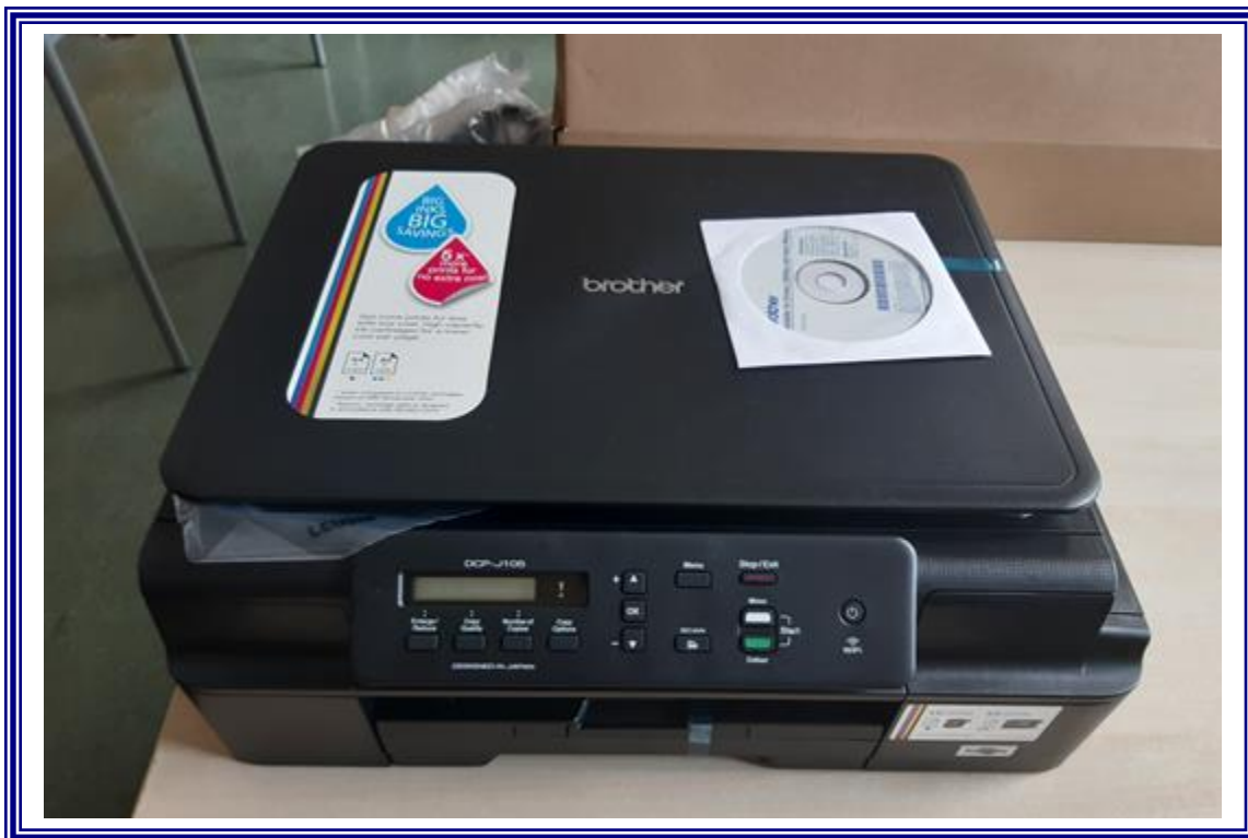
Zakup wyposażenia do pracowni szkolnych w ramach realizacji projektu „Dobry zawód to przyszłość – II edycja” dla uczniów Zespołu Szkół Nr 2 w Aleksandrowie Kujawskim”.