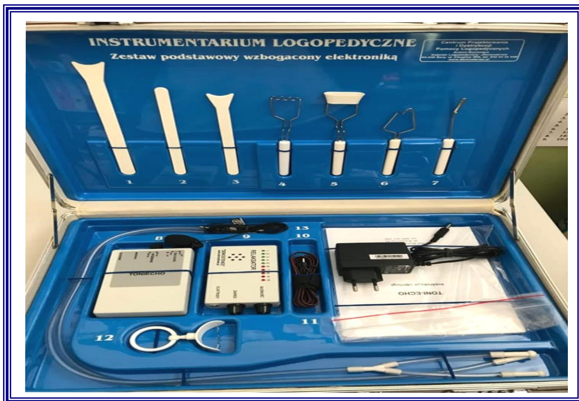
Zakup wyposażenia w ramach realizacji projektu „Dobry zawód to przyszłość – II edycja” dla uczniów Szkoły Podstawowej Specjalnej Nr 4 w Aleksandrowie Kujawskim.