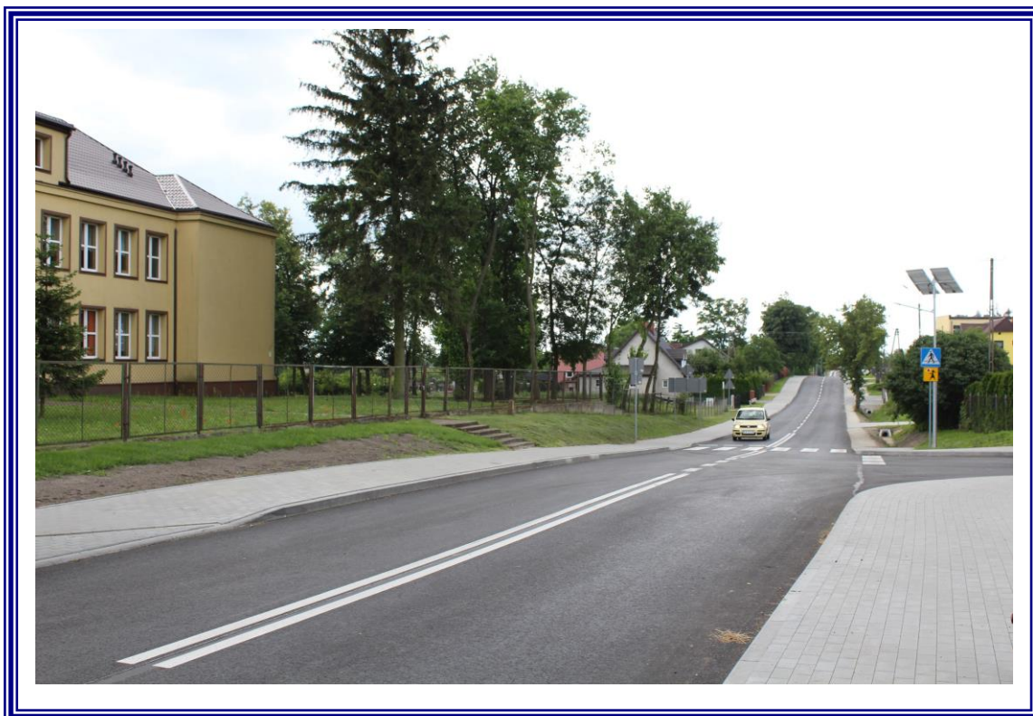
„Przebudowa drogi powiatowej Nr 2603C Ciechocinek – Siutkowo wraz z przepustami – zadanie nr 1 - etap II – odcinek o długości 0,911 km”.