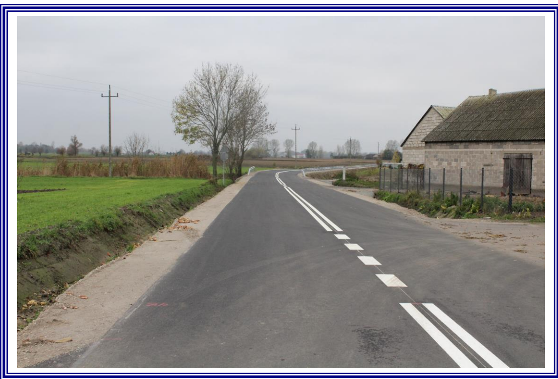
„Przebudowa drogi powiatowej Nr 2610C Turzno – Seroczki na odcinku od km 13+518 – odcinek o długości 4,412 km”.