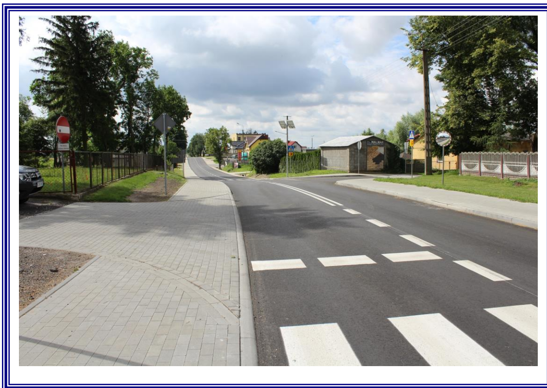
„Przebudowa drogi powiatowej Nr 2603C Ciechocinek – Siutkowo wraz z przepustami – zadanie nr 1 - etap II – odcinek o długości 0,911 km”.