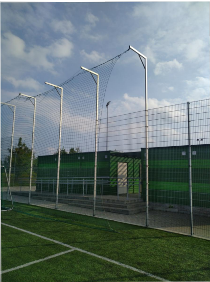
Schemat montażu siatki piłkochwytu

Siatka piłkochwytu z polipropylenu zawieszona na wsporniku gr. splotu 5mm, grubość oczek 10x10cm