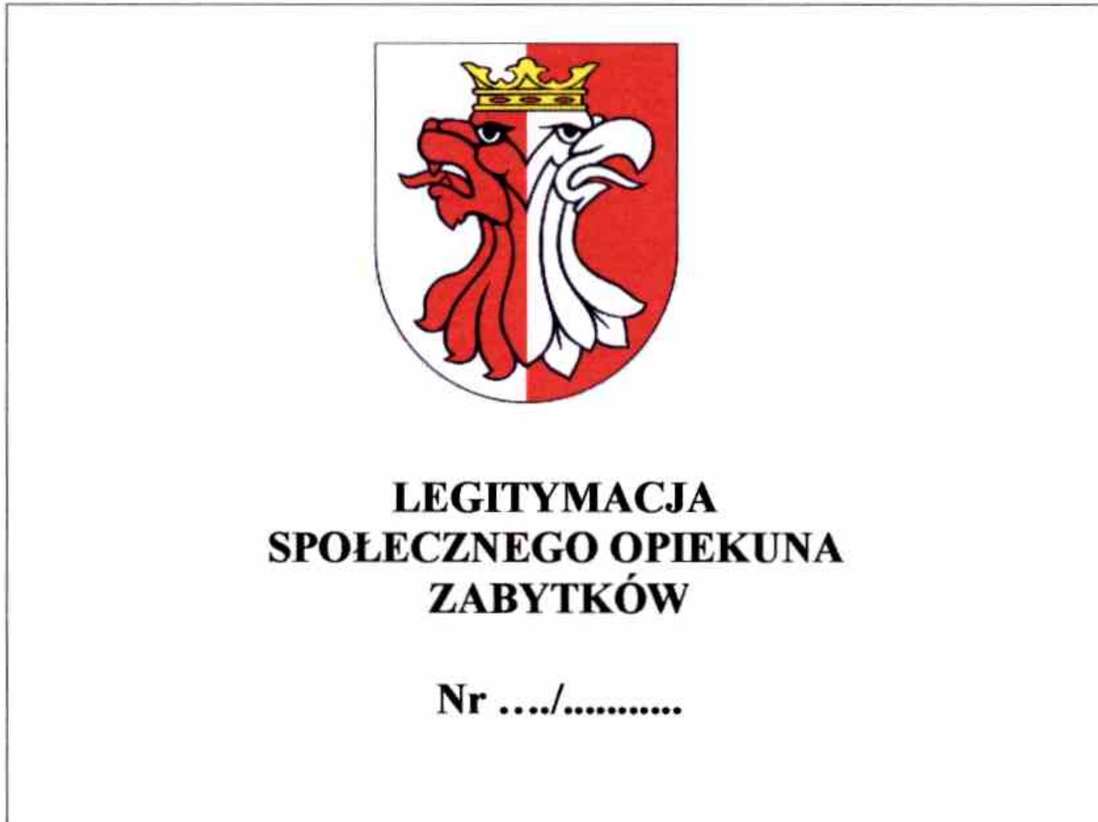
wzór strony nr 1